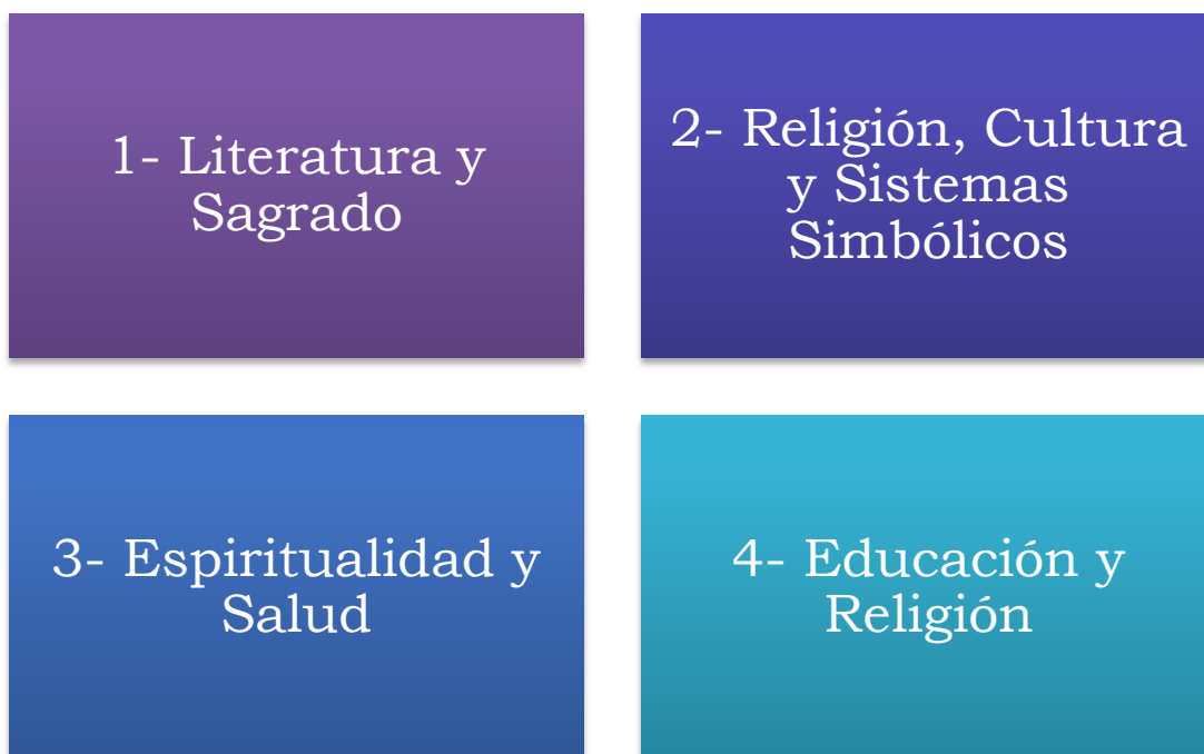
Figura 1 - Líneas de investigación y actividades en las prácticas supervisadas de la Licenciatura en Ciencias Religiosas de la UFPB.

Desde esta perspectiva, comencé mi investigación sobre la creación del sitio web, qué recursos usar, cómo construir una estructura, información sobre las partes internas (que el público no ve), después de la investigación comencé a crear un sitio web usando Webnode (sistema en línea). creación y edición de sitios web) para conocer un poco lo que me esperaba durante la experiencia de pasantía. Después de crear el sitio web, sería necesario completar las "pestañas", por lo que necesitaba investigar sobre las cuatro líneas de investigación (que son las cuatro prácticas supervisadas obligatorias):